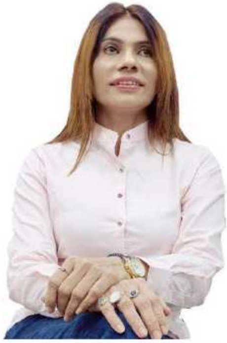
संपादक सीमा गुप्ता

जेकेएस संवाददाता भायंदर : २०२३-२४ के आर्थिक वित्तीय बजट में किसी भी प्रकार के कर की वृद्धि या कोई नया कर नहीं लगाने का झांसा देकर मनपा प्रशासन ने अब नए-नए करों और कर दर की वृद्धि का पिटाटा खोल दिया है। हाल ही में पानी के दर में वृद्धि तथा जलापूर्ति लाभ कर के रूप में नये कर का बोझ नागरिकों पर डालने का प्रशासकीय प्रस्ताव पारित करने के बाद, मीरा-भायंदर महानगरपालिका की परिवहन