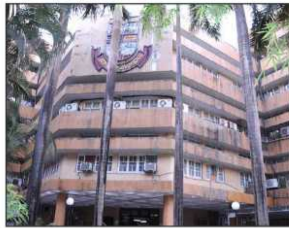
किया गया। प्रशासकीय पर अभी तक मनपा ने १० कामकाज के दौरान नागरिकों फीसदी रास्ता कर १० से १५