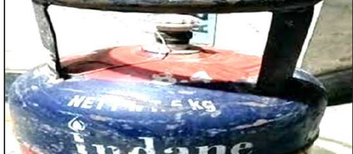
रुपए पर थी, जबकि १ नवंबर को इसके रेट १०१.५० रुपए महंगे हुए थे और यह १,८३३ रुपए प्रति सिलिंडर हो गया था। इसके बाद १६ नवंबर को

जेकेएस संवाददाता पालघर : देश के ५ राज्यों में विधानसभा चुनाव खत्म होते ही सरकार का एक फिर महंगाई बम फूटा है। पहले से ही महंगाई की मार से झेल रही जनता को सरकार ने एक और झटका देते हुए फिर एलपीजी सिलिंडर के दाम बढ़ा दिए हैं। ये बढ़ोतरी १९ किलोग्राम वाले कमर्शियल गैस सिलिंडर पर हुई है और इसके रेट में २१ रुपए प्रति सिलिंडर का इजाफा किया गया है। १ दिसंबर २०२३ से आपको राजधानी दिल्ली में कमर्शियल गैस सिलिंडर के लिए